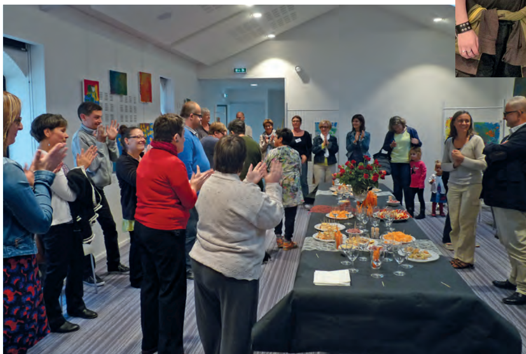
Vernissage de l'exposition de peinture des enfants des écoles de Saint-Gervais et des adultes du CAT de Challans